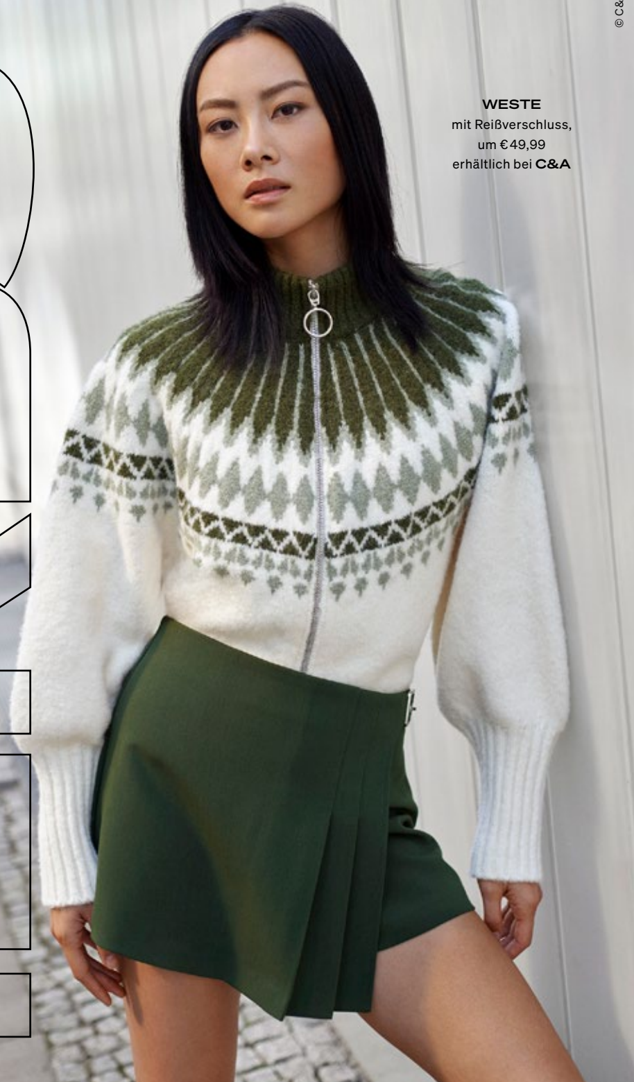
WESTE mit Reißverschluss, um € 49,99 erhältlich bei C&A