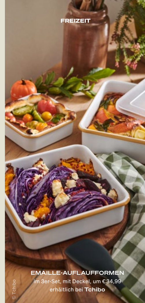
EMAILLE-AUFLAUFFORMEN im 3er-Set, mit Deckel, um €34,99 erhältlich bei Tchibo